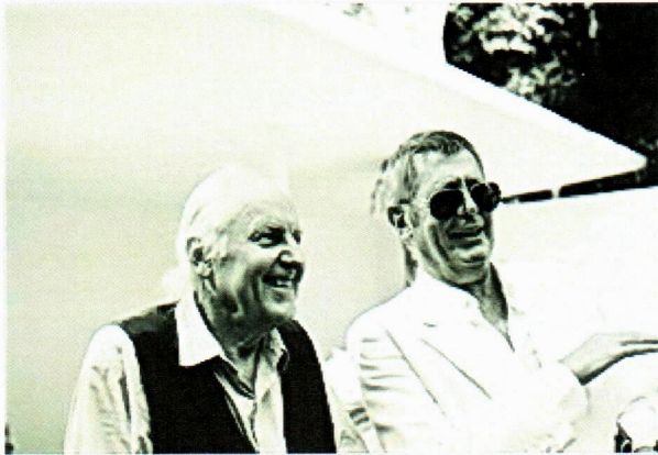
Hans Hollein und Wolf Prix.

Wolf Prix und Hans Hollein waren Freunde und Kollegen. Am 5. Mai hielt der Chef des Wiener Büros Coop Himmelb(l)au in der Galerie Ulysses in Wien eine Abschiedsrede, die ursprünglich als Eröffnungsrede zur Ausstellung konzipiert war